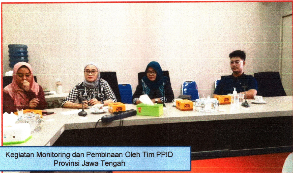
Kegiatan Monitoring dan Pembinaan Oleh Tim PPID Provinsi Jawa Tengah