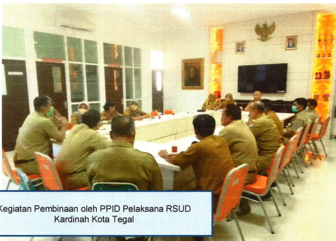
Kegiatan Pembinaan oleh PPID Pelaksana RSUD Kardinah Kota Tegal