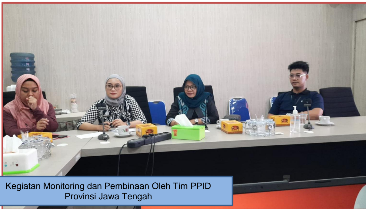
Kegiatan Monitoring dan Pembinaan Oleh Tim PPID Provinsi Jawa Tengah