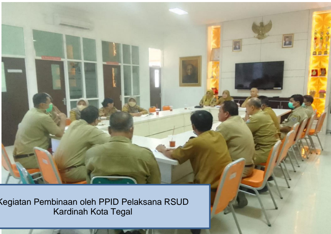
Kegiatan Pembinaan oleh PPID Pelaksana RSUD Kardinah Kota Tegal